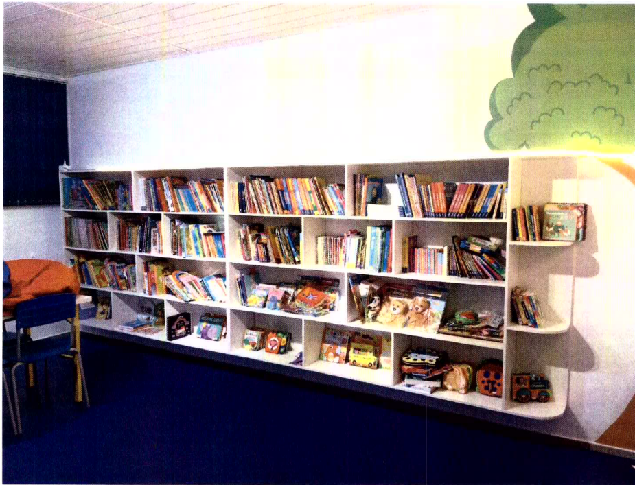
Foto 7 – Revitalização da Biblioteca com aquisição de piso tátil, prateleiras e acervo bibliográfico