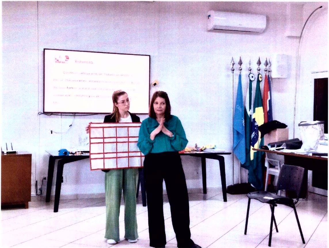
Imagem 4: Curso de formação dos profissionais da entidade.