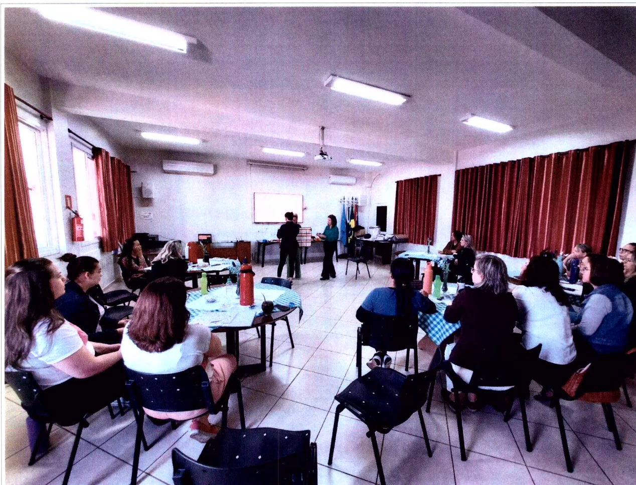
Imagem 5: Curso de formação dos profissionais da entidade.