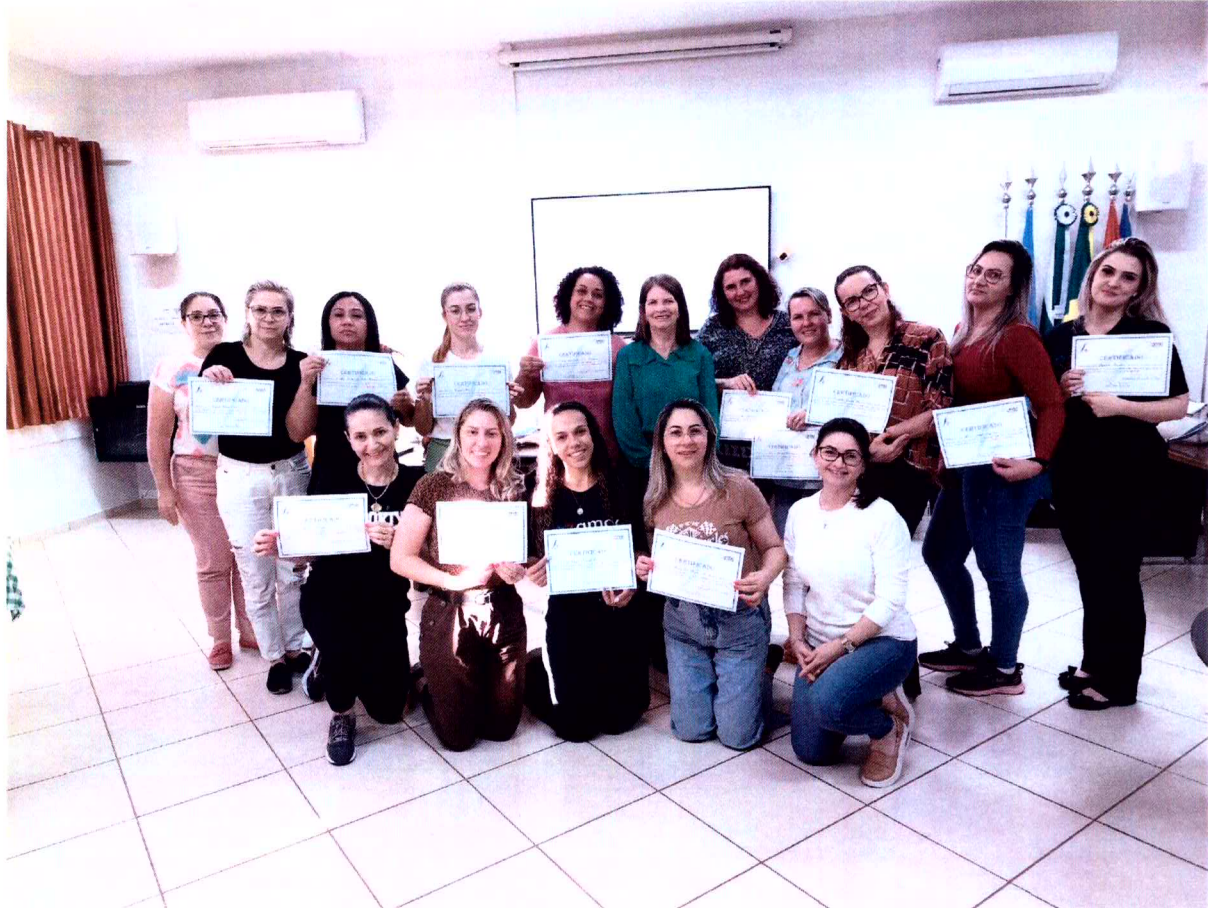
Imagem 3: Curso de formação dos profissionais da entidade.