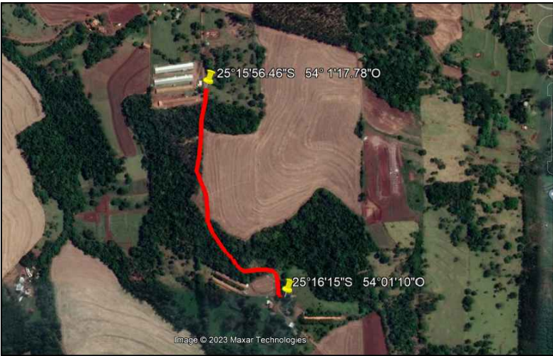
PLANTA DE LOCALIZAÇÃO REGIONAL SEM ESCALA