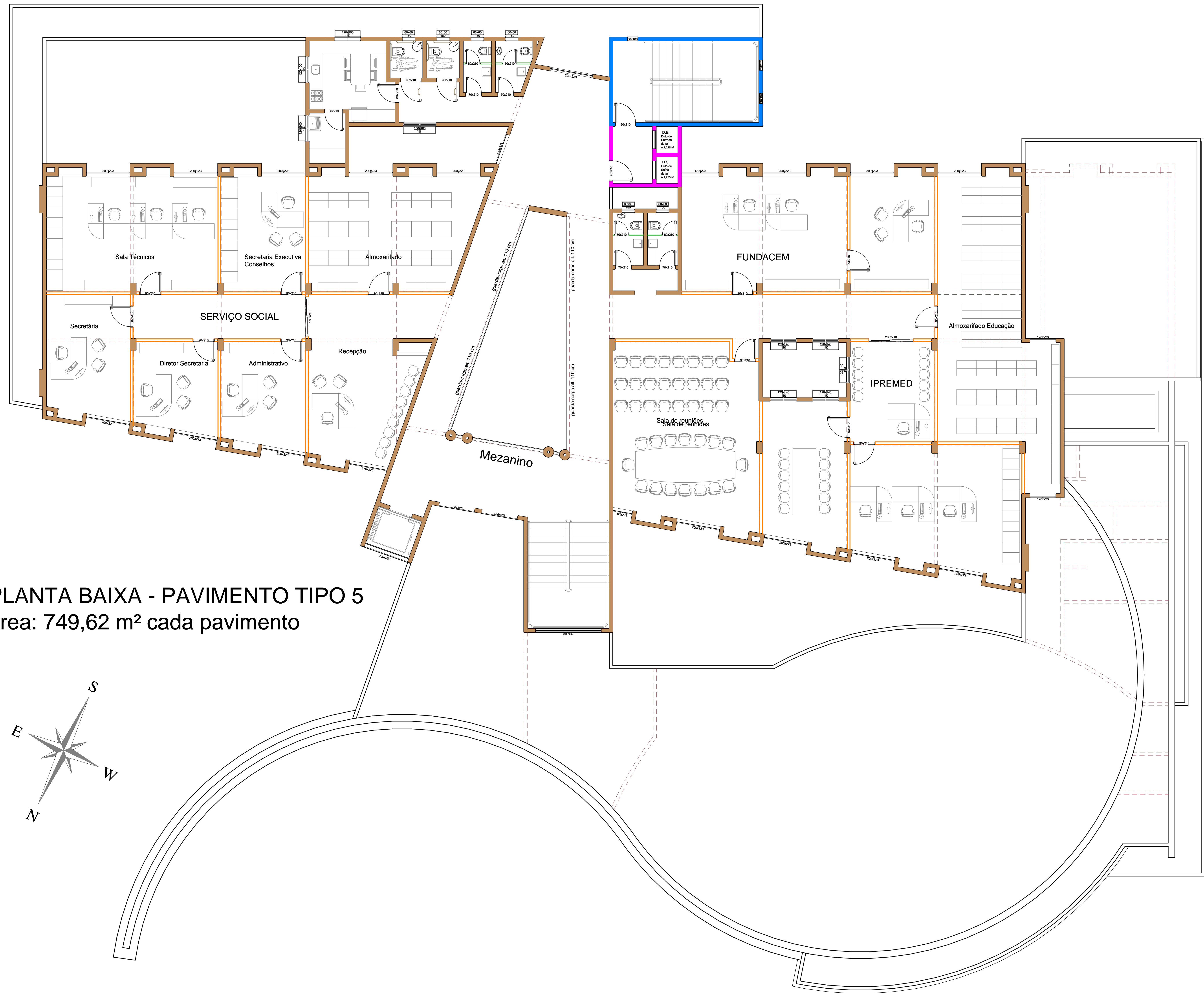
PLANTA BAIXA - PAVIMENTO TIPO 5 área: 749,62 m² cada pavimento