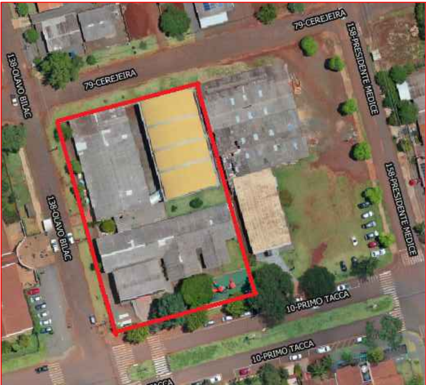
LOCALIZAÇÃO sem escala

NOTA: Artigo 21 – Para fins de aplicação deste Código, no cálculo da área a ser protegida com as medidas de segurança contra incêndio, não serão computados: IV - as coberturas de bombas de combustível, praças de pedágio, terminais de passageiros e de quadras poliesportivas desde que não sejam utilizadas para outros fins e sejam abertas lateralmente ; VI - piscinas, banheiros, vestiários e semelhantes, no tocante a sistemas hidráulicos, alarme de incêndio e compartimentação;