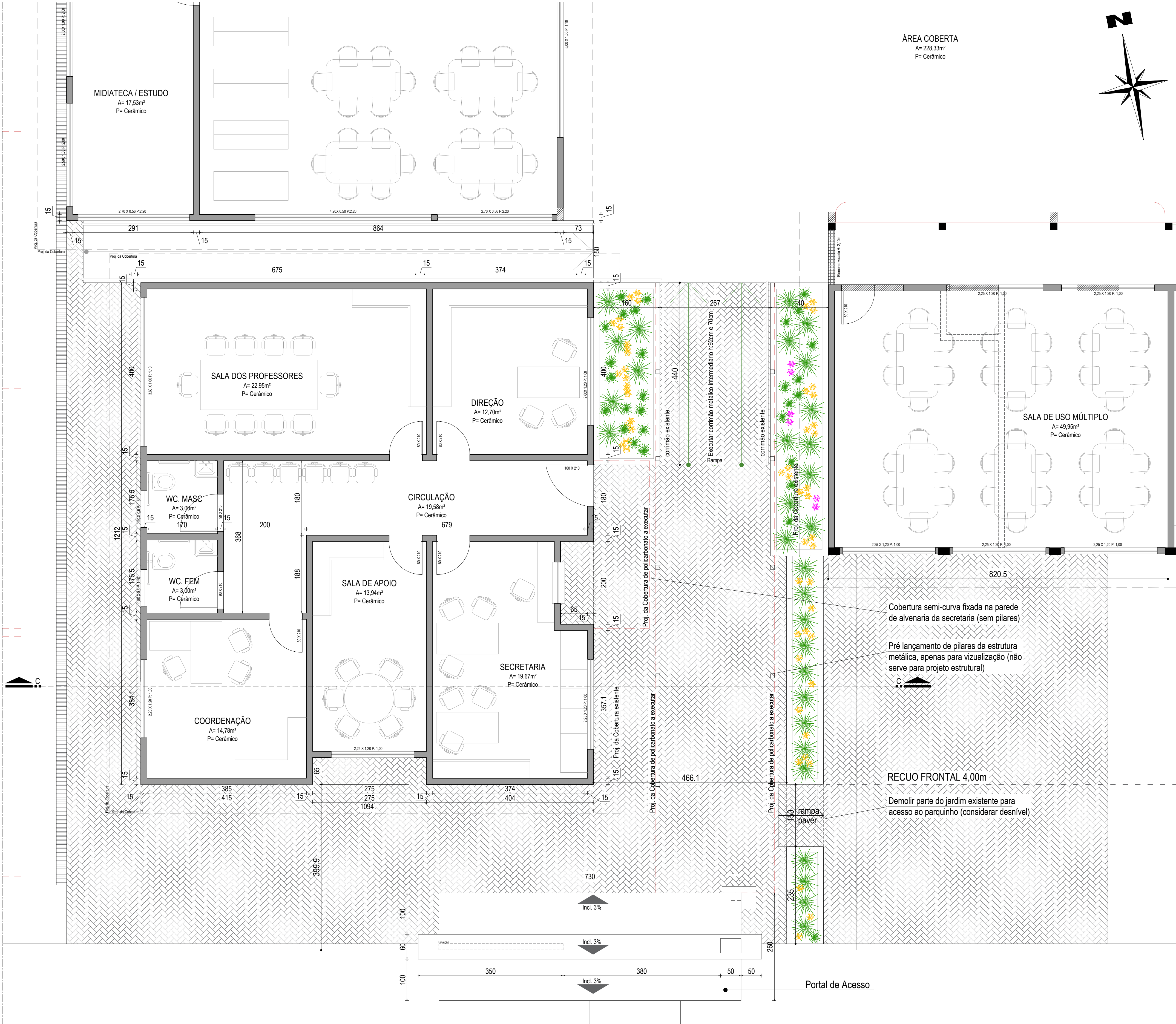
PLANTA DE COBERTURA TRECHO APROXIMADO Escala: 1/50

Observação: - Os responsáveis pela fabricação da cobertura e corrimão devem verificar as dimensões no local antes da produção.