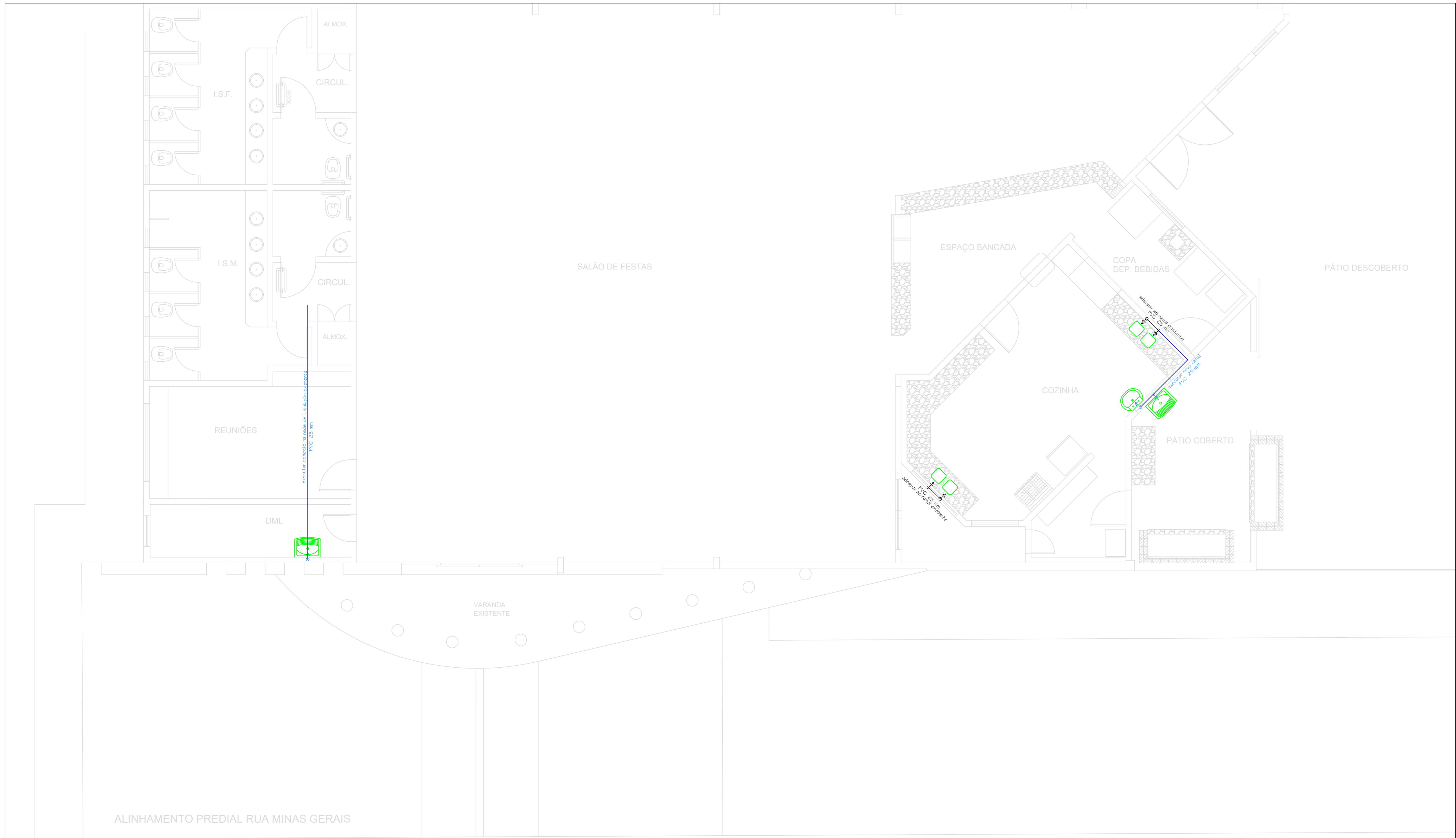
PLANTA BAIXA - ÁGUA FRIA ESCALA.....1:75