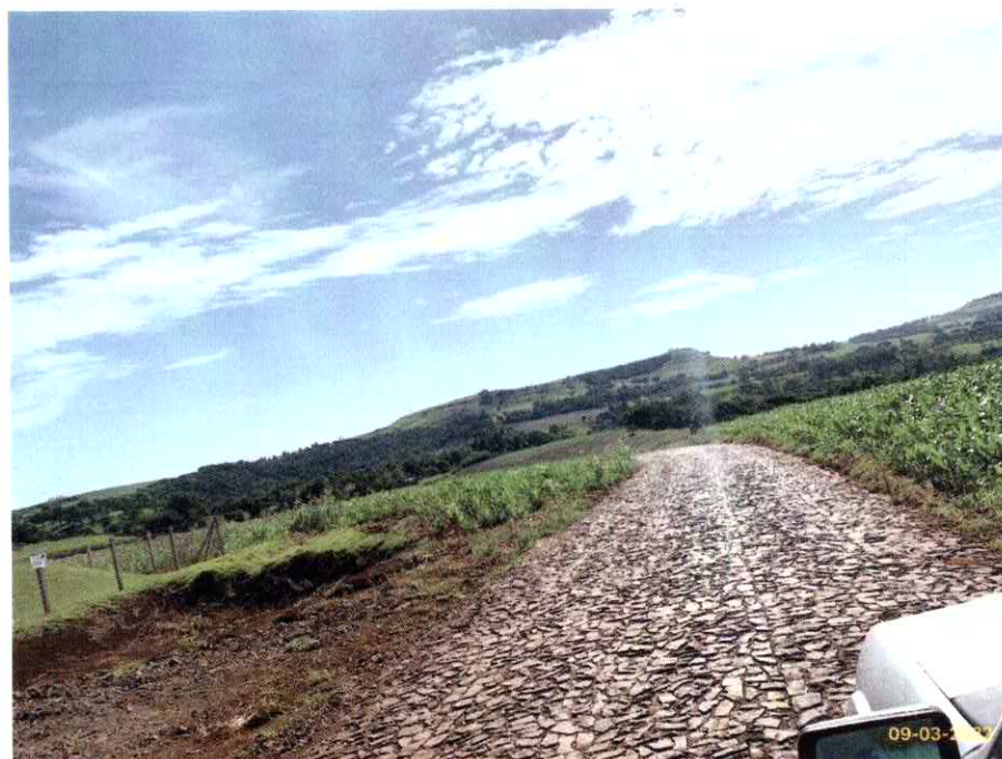
Imagem 03