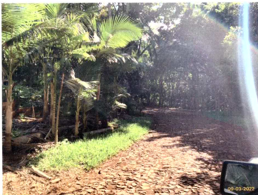
Imagem 05