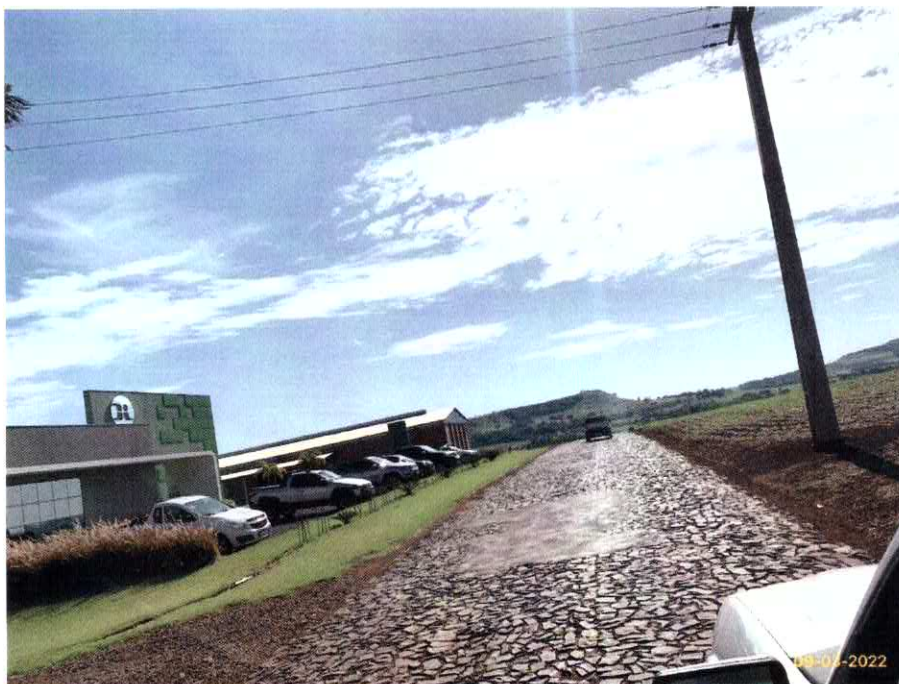
Imagem 02 - Fonte: autoria própria.