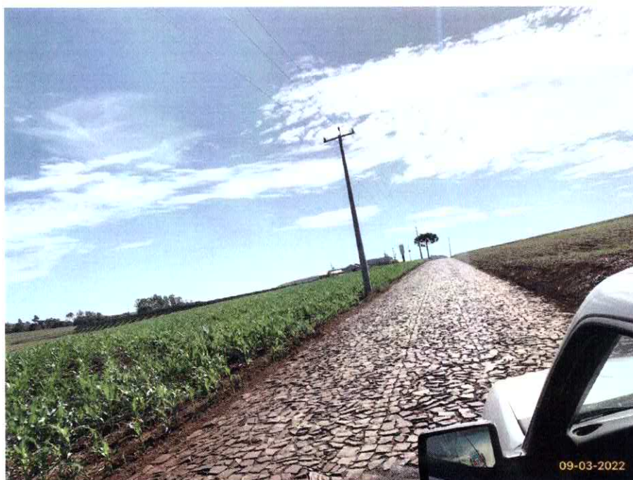
Imagem 01 – Início do trecho