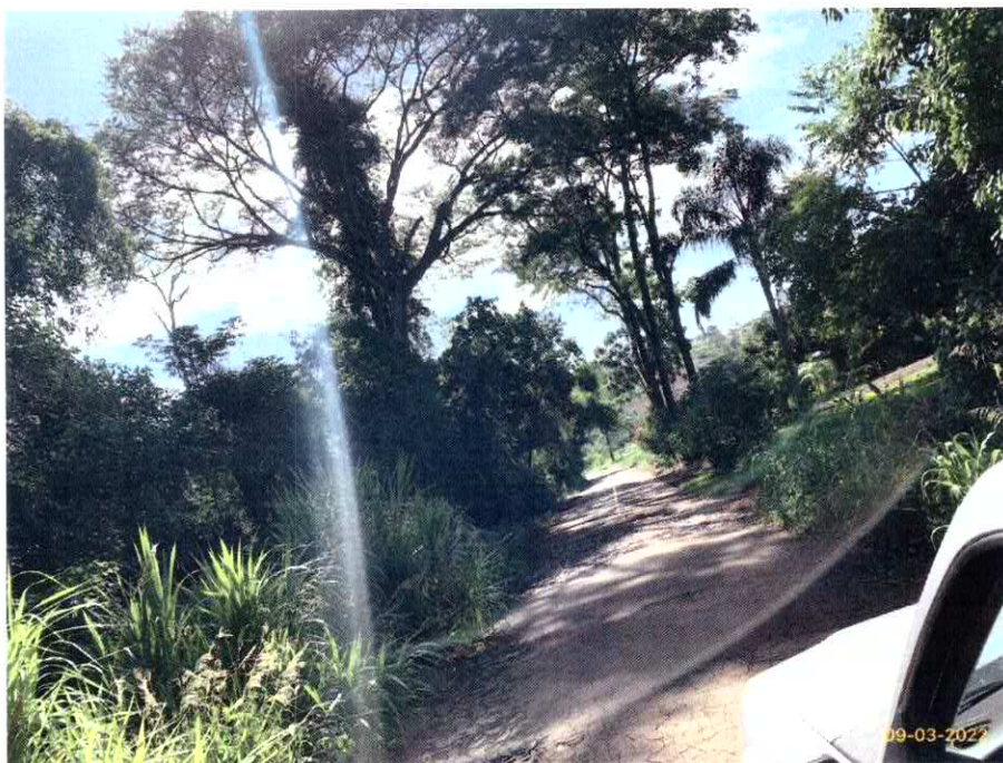
Imagem 07 – Final do trecho