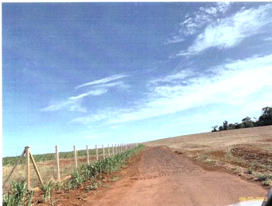
Imagem 04